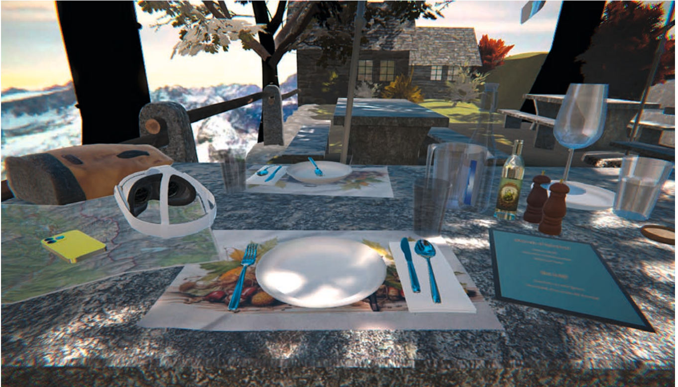
Auf einer virtuellen Reise in Alltagssituationen Italienisch lernen: Das bietet die Lern-App «Viagg-io».