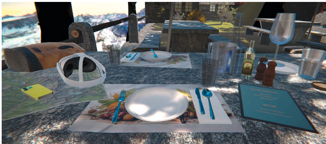
Apprendre l'italien à travers un voyage virtuel dans des situations de la vie quotidienne : c'est ce que propose l'application d'apprentissage « Viagg-io ».